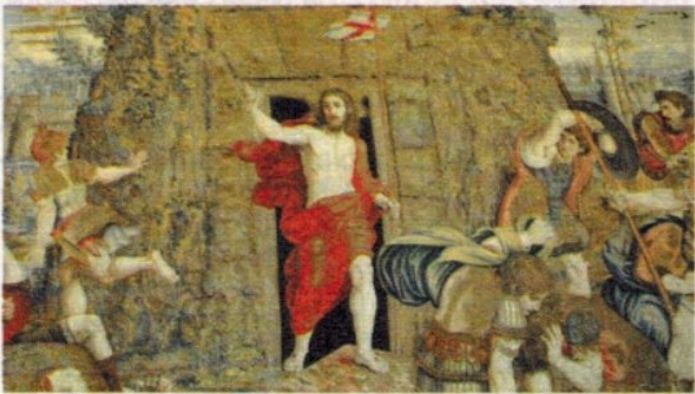
«La risurrezione di Cristo», opera di scuola raffaellesca. Galleria degli Arazzi (Musei Vaticani).