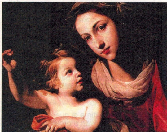
"Madonna col Bambino", Massimo Stanzione (ca. 1640). Museo Nazionale di Capodimonte, Napoli.

Benedetto XVI, Spe salvi (lettera enciclica sulla speranza cristiana, 30 novembre 2007), nn. 49-50. Copyright © Dicastero per la Comunicazione - Libreria Editrice Vaticana.