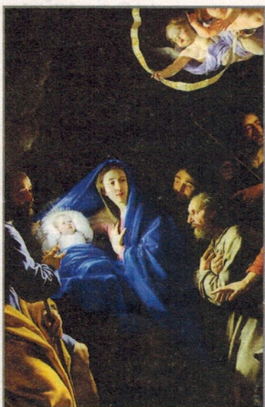
ADORAZIONE DEI PASTORI / PH. DE CHAMPAIGNE