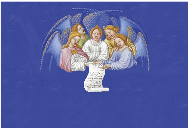
LO SPIRITO DEL SIGNORE E' SU DI ME (Comunione)

Prendi il nostro niente, riempilo di te, Signore, e saremo testimoni del tuo amore. Prendi il nostro cuore, trasformalo nel tuo, Signore come te vivremo nella santità Rit.